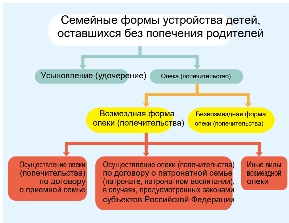
Рис. 1. Семейные формы устройства детей, оставшихся без попечения родителей, по данным Министерства образования и науки Российской Федерации

Семейное законодательство РФ предусматривает две основные формы семейного устройства (рис. 1): усыновление (удочерение) и опека (попечительство).