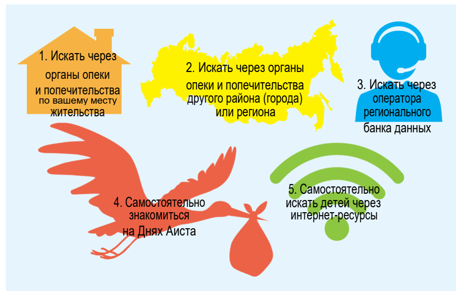
Рис. 3. Варианты подбора ребенка

Важно отметить, что достоверную информацию по этому вопросу, а также направление на посещение ребенка вам могут предоставить только органы опеки и попечительства по месту нахождения организации для детей-сирот либо оператор регионального банка данных.